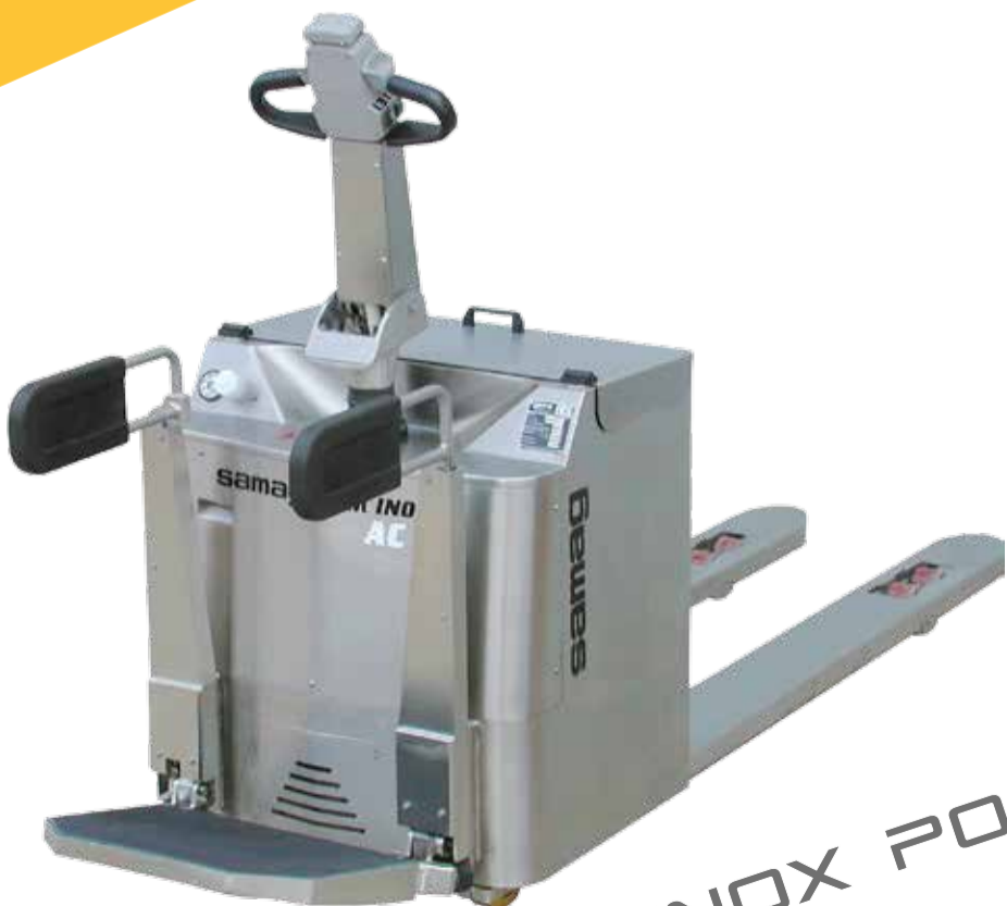
TM INOX PO