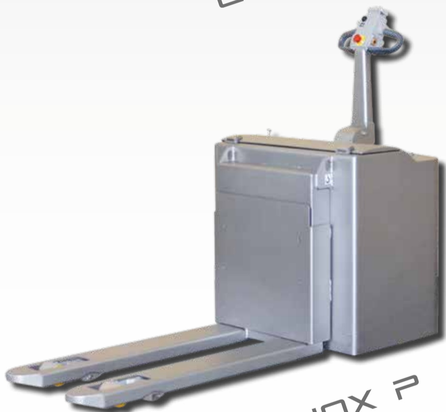
TM INOX P