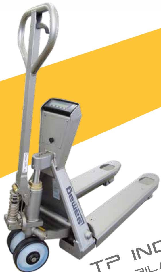
TP INOX CON BILANCIA