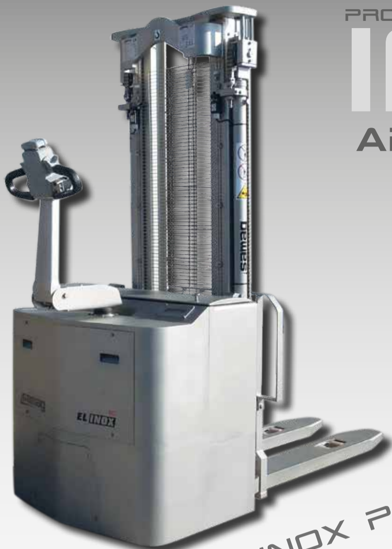
EL INOX P