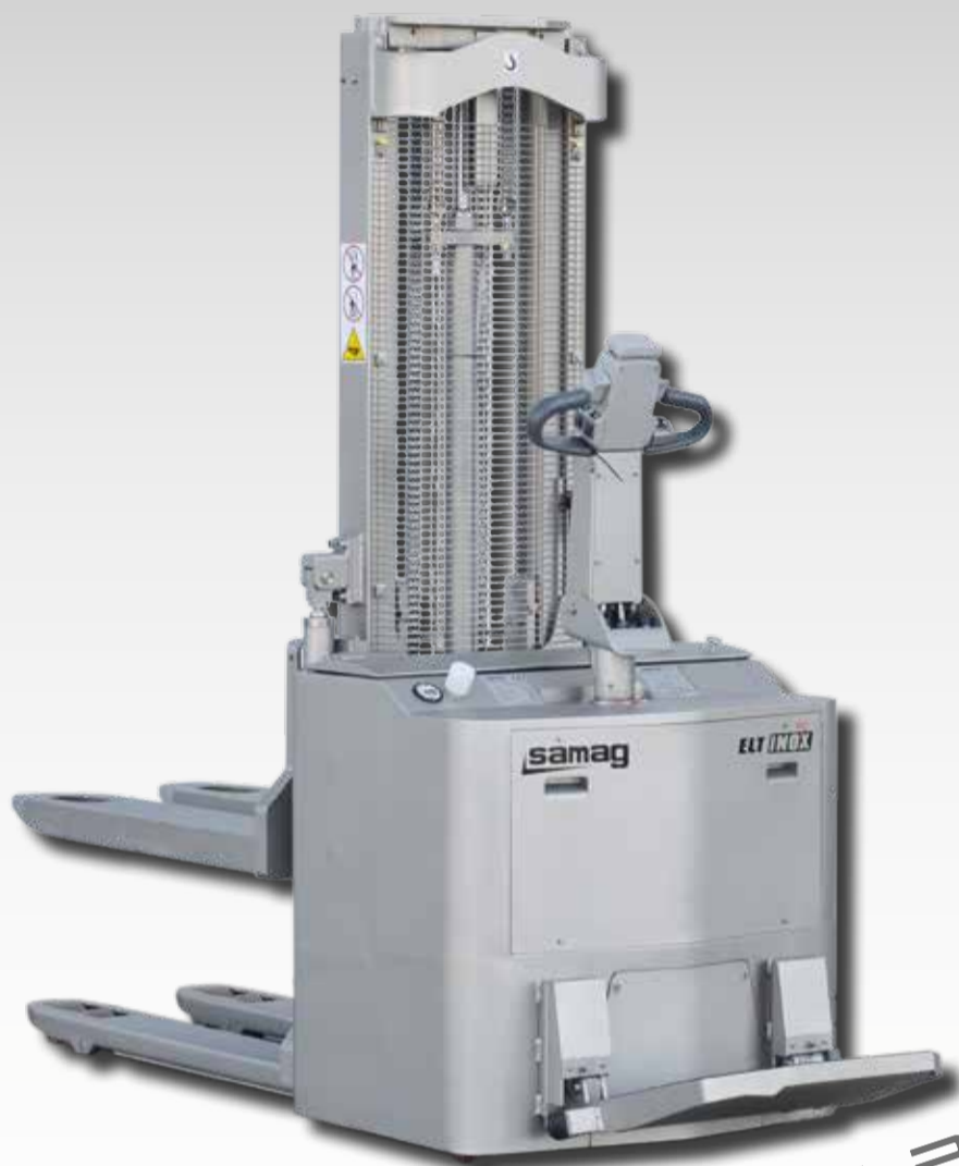
ELT INOX P